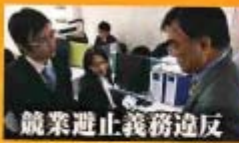
競業禁止義務違反